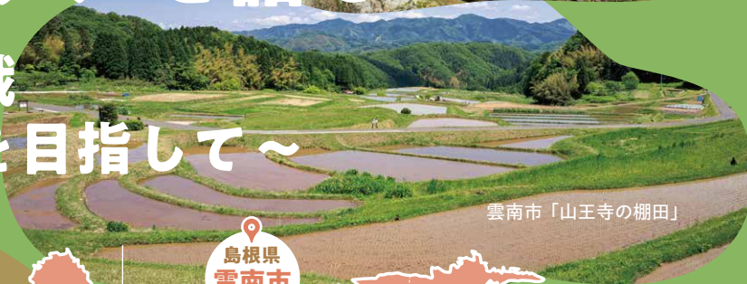
雲南市「山王寺の棚田」