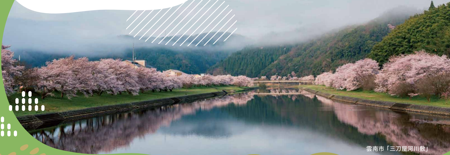
雲南市「三刀屋河川敷」