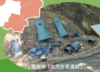
雲南市「加茂岩倉遺跡」