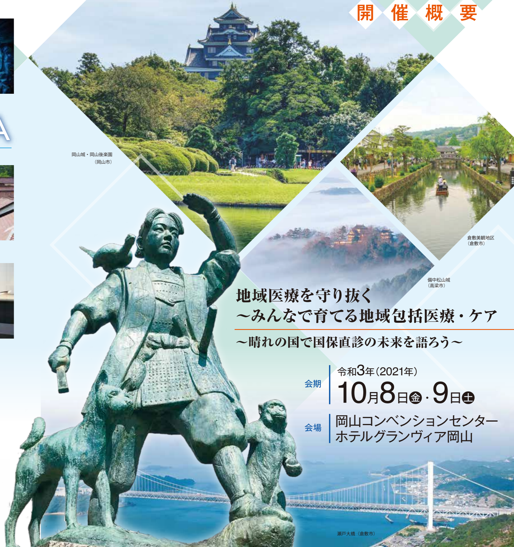
岡山城・岡山後楽園 (岡山市)