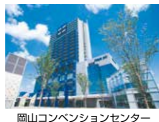
岡山コンベンションセンター