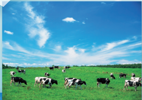
別海町：乳牛の風景