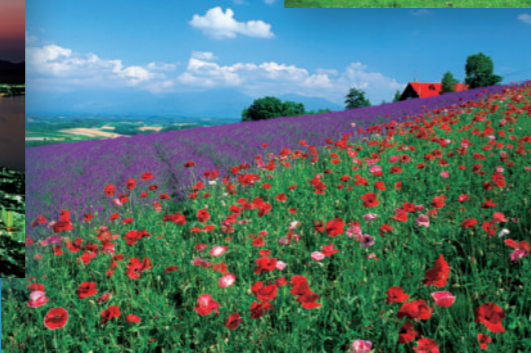
上富良野町：ラベンダー