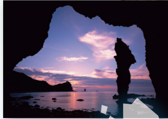
積丹町：水無の立岩