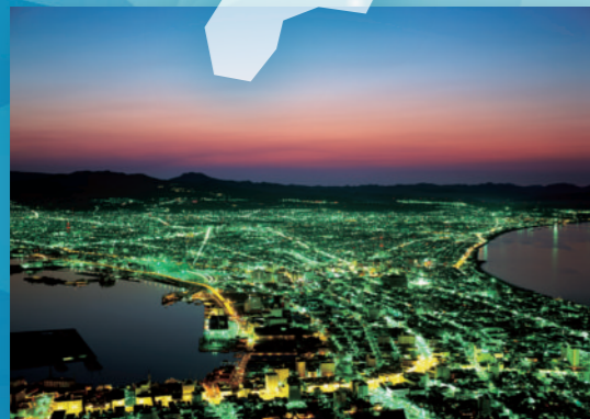
函館市：市街地の夜景