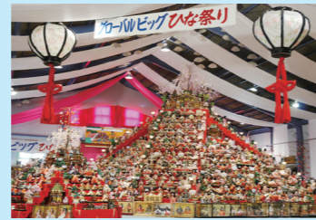
④ビッグひな祭り 勝浦町