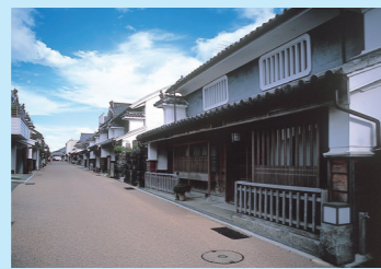
③うだつの町並み 美馬市