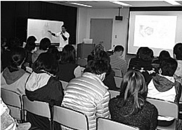
写真7 いきいきネットワーク研修会