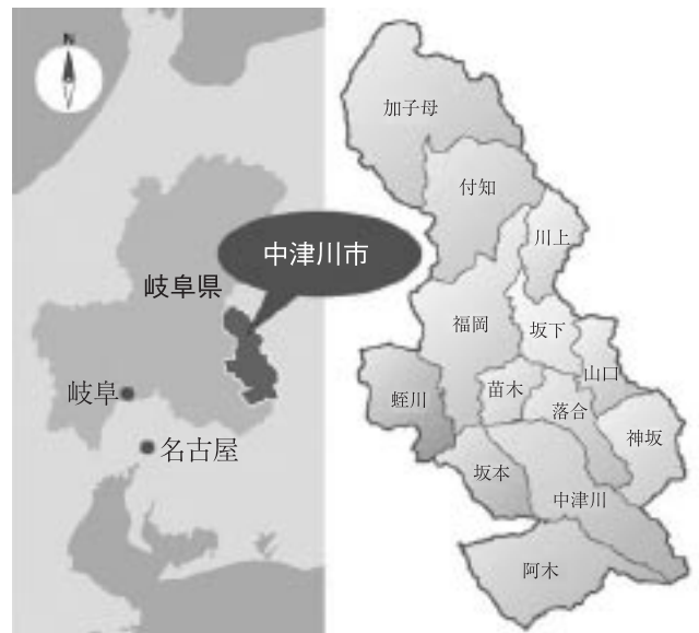
図1 中津川市の位置

現在は平成17年2月に、長野県山口村を含めた1市7町村の合併により中津川市となったため、中津川市の国保坂下病院として、内科、小児科、外科、整形外