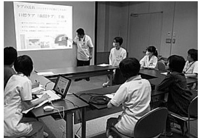
写真6 口腔機能リハビリテーション委員会