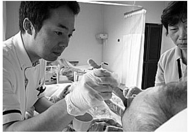
写真9 介護施設での摂食・嚥下指導