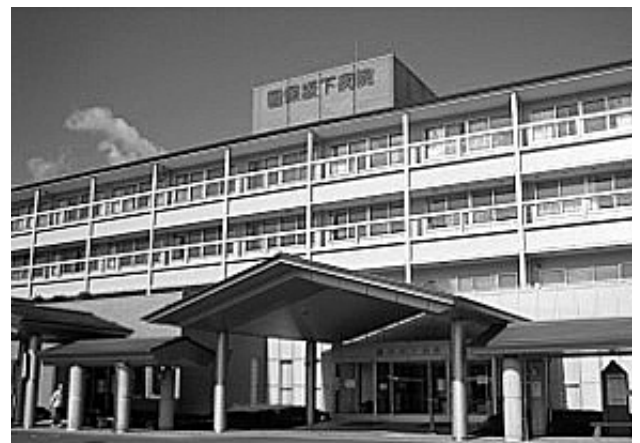
写真1 国保坂下病院外観