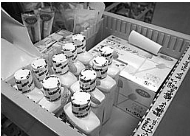
写真5 病棟の口腔ケア備品

備されており、必要性が出たときにすぐにケアできる体制ができている。嚥下練習用のゼリーやとろみ剤なども同様に常備されており、必要と思ったときにすぐに使用できるようになっている。このような備品などの管理も口腔機能リハビリテーション委員会が行っている（写真5）。