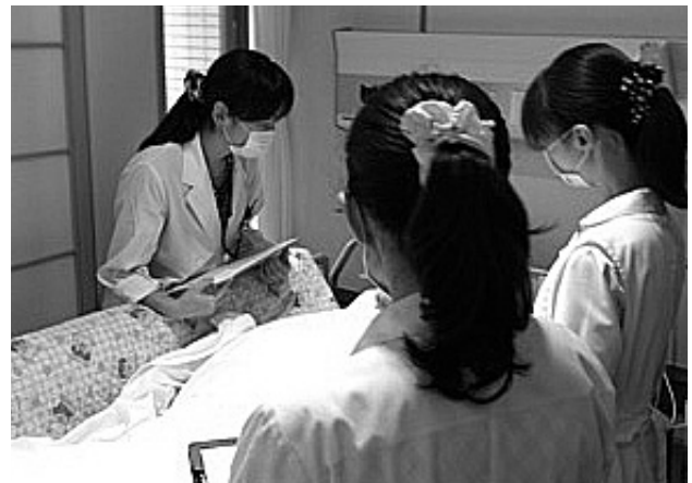
写真3 口腔機能リハビリテーション回診

行っており、「歯科衛生士の口腔ケア指導を行ったことで口腔内細菌がどう変化するか」「口臭チェッカーを使用したの口腔ケア判定」「歯茎ケアを導入した口腔ケアの検討」などを研究し、院内研究発表会や国保地域医療学会などで報告してきた。実際に効果を実感することで口腔ケアに対する意識を高めることができ、口腔ケアの手技を統一することで、よりよい口腔ケアを提供することができるようになったことを実感している。口腔機能リハビリテーション委員会では、口腔ケアだけではなく、摂食嚥下についてもより専門的に対応できるように検討を進めている。診療放射線技師にも協力してもらい、嚥下造影検査も積極的に進めている（写真4）。