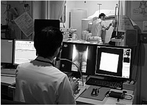
写真4 嚥下造影検査