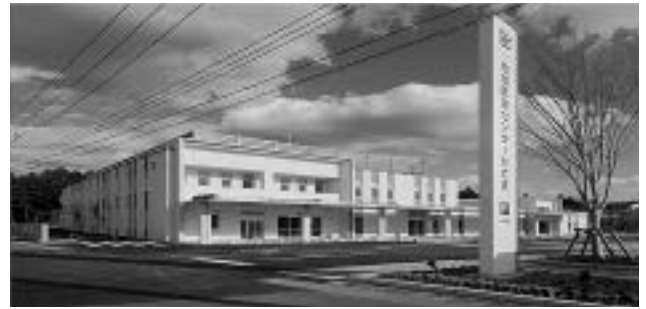
写真2 笠間市立病院 平成30年4月新棟移転

平成27年4月から看護師の人事交流を開始した。同市内でありながら顔の見える関係でなかったことや、教育体制の支援も含めた連携強化を目的とした人事交流である。筆者は初年度の人事交流において、2年間