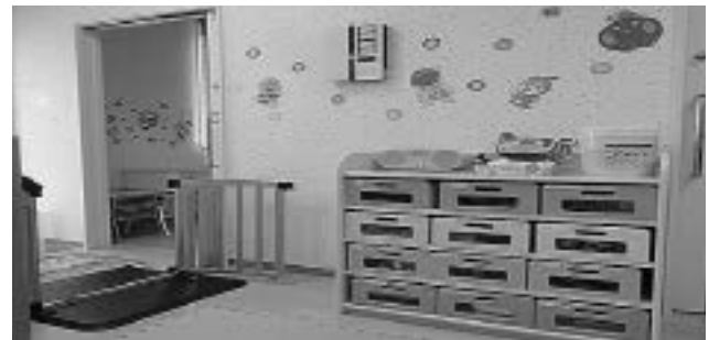
写真3 笠間市立病院 病児保育

看護局長として派遣となった。病床数も設備も環境も違う病院は戸惑いだらけであった。しかし、全職員が顔の見える関係であり、アットホームな環境はすぐに好きになった。中堅看護師が多く、高齢者や認知症患者の対応に関しては質の高い看護がされていた。建て替え直前の古い病院であったため、建物は老朽化し雨が降るとバケツや洗面器が活躍した。筆者は過去にタイムスリップしたが、当院に派遣となった看護師は、未来にタイムスリップしたのだから、その努力は大変なものであったと推測される。