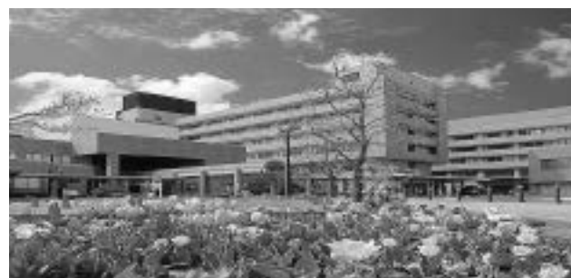
写真1 茨城県立中央病院・地域がんセンター

当院は、昭和31年1月に茨城県友部療養所として結核の治療を行うために開設された。医療需要に対応するため昭和32年10月に総合病院となり、平成7年には病床数100床の地域がんセンターを併設し、総病床数500床に拡充となった。平成18年には地方公営企業法の全部適用となり、病院局が設置された。茨城県唯一の県立総合病院として、難治性がんなどの高度・特殊