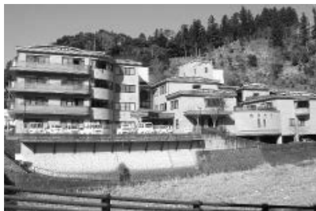
写真1 梶原病院・保健福祉支援センター外観