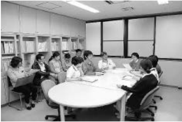
写真2 ケアプラン会

用率は、後期高齢者が大半を占め続けることも同様であり、退院調整は今まで以上に看護業務の主要な時間を割く必要があると見込まれる。