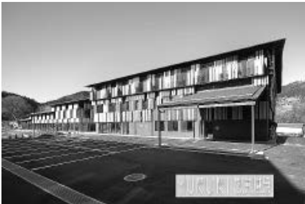
写真3 梶原町複合福祉施設「YURURIゆすはら」外観

設を利用せざるを得ない高齢者がいた。そして、平成30年4月1日、念願であった梶原町複合福祉施設「YURURIゆすはら」がオープンした(写真3、表4)。