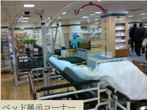
ベッド展示コーナー 自助具作成工房