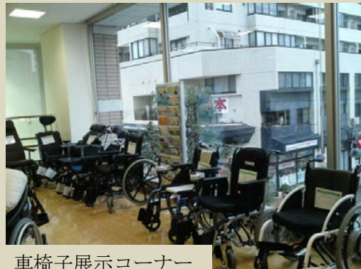
車椅子展示コーナー 啓発資料