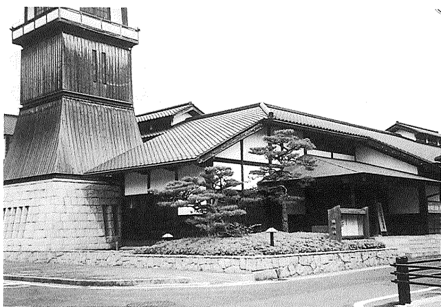
写真3 宿場町をイメージさせる「やかげ郷土美術館」

建物は平成7年に建てられたものだが、吉備地方の瓦屋根を模した造りで、手入れが行き届いているせいか、いまだに新しさを感じさせた。1階は広々とした