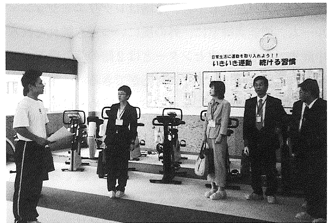
写真3 矢掛町健康管理センターのトレーニングルーム

「たかまつ荘」から渡り廊下を経て、病院2階の療養病棟へ。健康管理センターへも病院から2階でつながっており、五色町方式が採用されていた。平成9年に改築して療養病棟58床に転換、うち介護型が16床で、さらにここからリハビリテーションセンターに直結する。リハビリ科は中国地方5県から毎年100名の参加者を集める研修会を開催するなど、この地域のトップクラスの活躍で、健康管理センターにもPTを1名配置して、保健・健康教育、在宅、医療、理学療法と地域密着型、生活密着型病院として包括的活動を行っている。3階は急性期病棟で23床休床中のため現在50床。内科・外科混合で平成8年に救急指定を受け、忙しい毎日が続く。