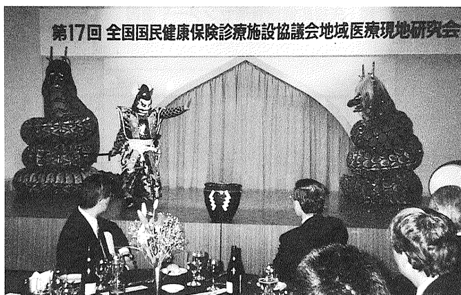
写真5 交流会では備中神楽のアトラクションも