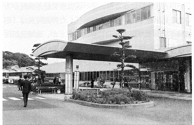
写真1 平戸市民病院

昭和23年頃から村営の診療所が開設され、入院患者数の増加等医療需要が高まるにつれて、昭和27年に紐差村立国保直営病院、津吉村立病院を開設。昭和30年に平戸島内にあった1町6か村が合併して平戸市が発足したことにより平戸市国保直営紐差病院（のちに国保紐差病院）、平戸市国保直営津吉病院（のちに国保津吉病院）と改称、昭和46年には平戸市医療体制整備計画に基づき、国保直営診療施設は統廃合され国保津吉病院が平戸市立南部病院となった。