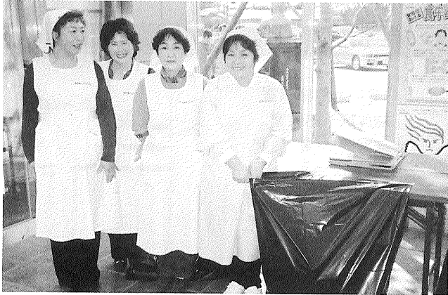
写真2 手づくり弁当を作ってくれた「ヘルスマート」会員

の方々30名が、朝6時から400人分作ってくれた手づくり弁当は、さっぱり味の押し寿司・すりみかまぼこ・昆布のつくだに・サラダ・浅漬け・みかんであった。美味しい手づくり弁当に感謝してご馳走になった(写真2)。