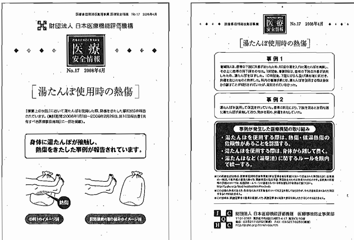
図表Ⅲ-3-6 医療安全情報No.17 「湯たんぽ使用時の熱傷」