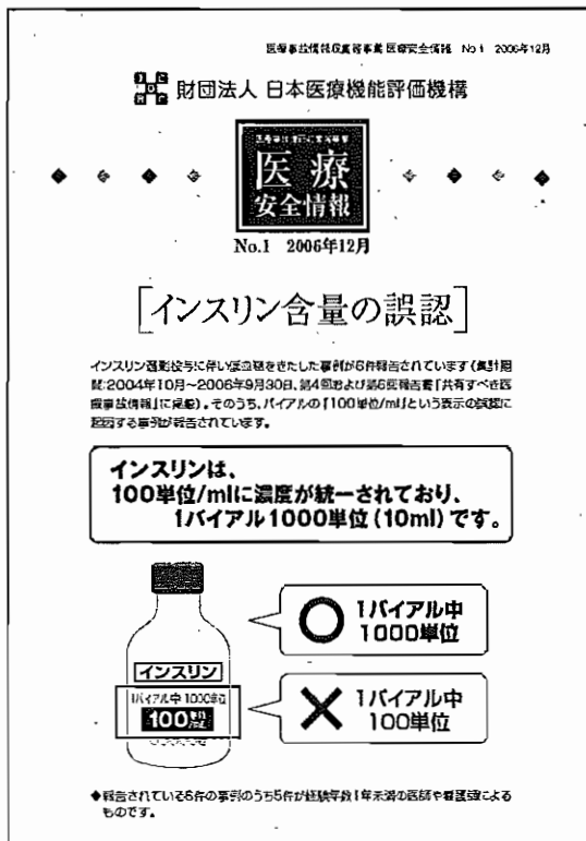
図表Ⅲ-3-3 医療安全情報No.1「インスリン含量の誤認」