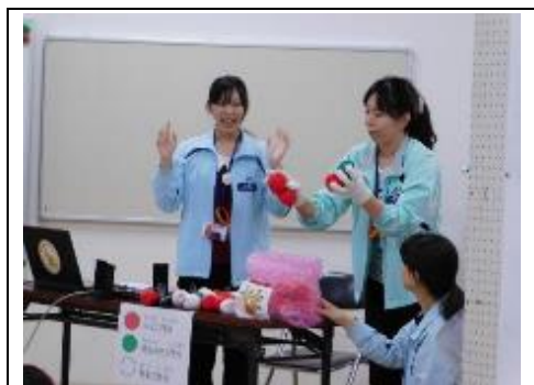
サポーター養成講座（学生編）