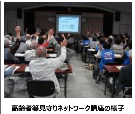
高齢者等見守りネットワーク講座の様子